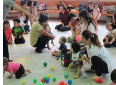
親子でリトミック