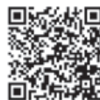
申込 QR コード

QRコードからの申込か申請書からの申請になります。すべてのプログラムは先着です。受付開始は7月3日(月)～各プログラムの締め切りまでです。