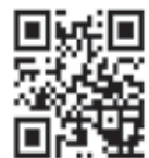
詳細は HP から