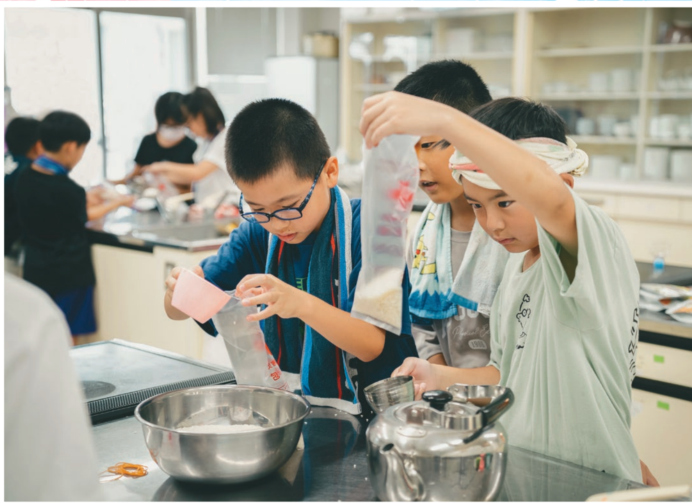
令和5年度ワークキャンプたのしく防災 (R5/7/27)