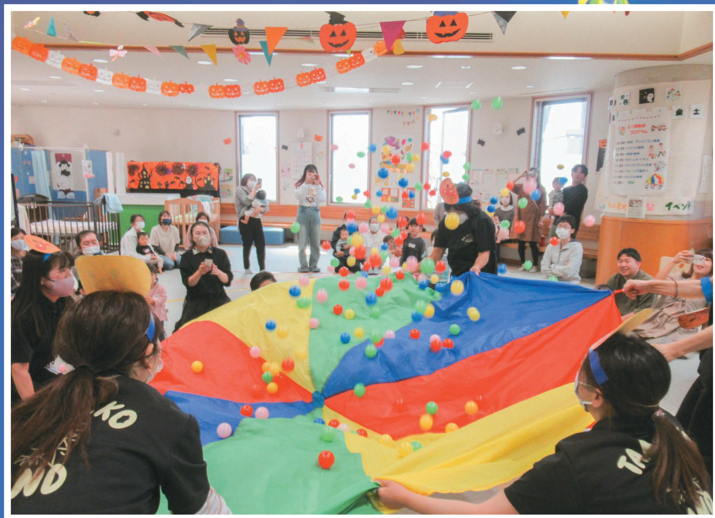
たまっ子らんどミニ運動会 (10/28)