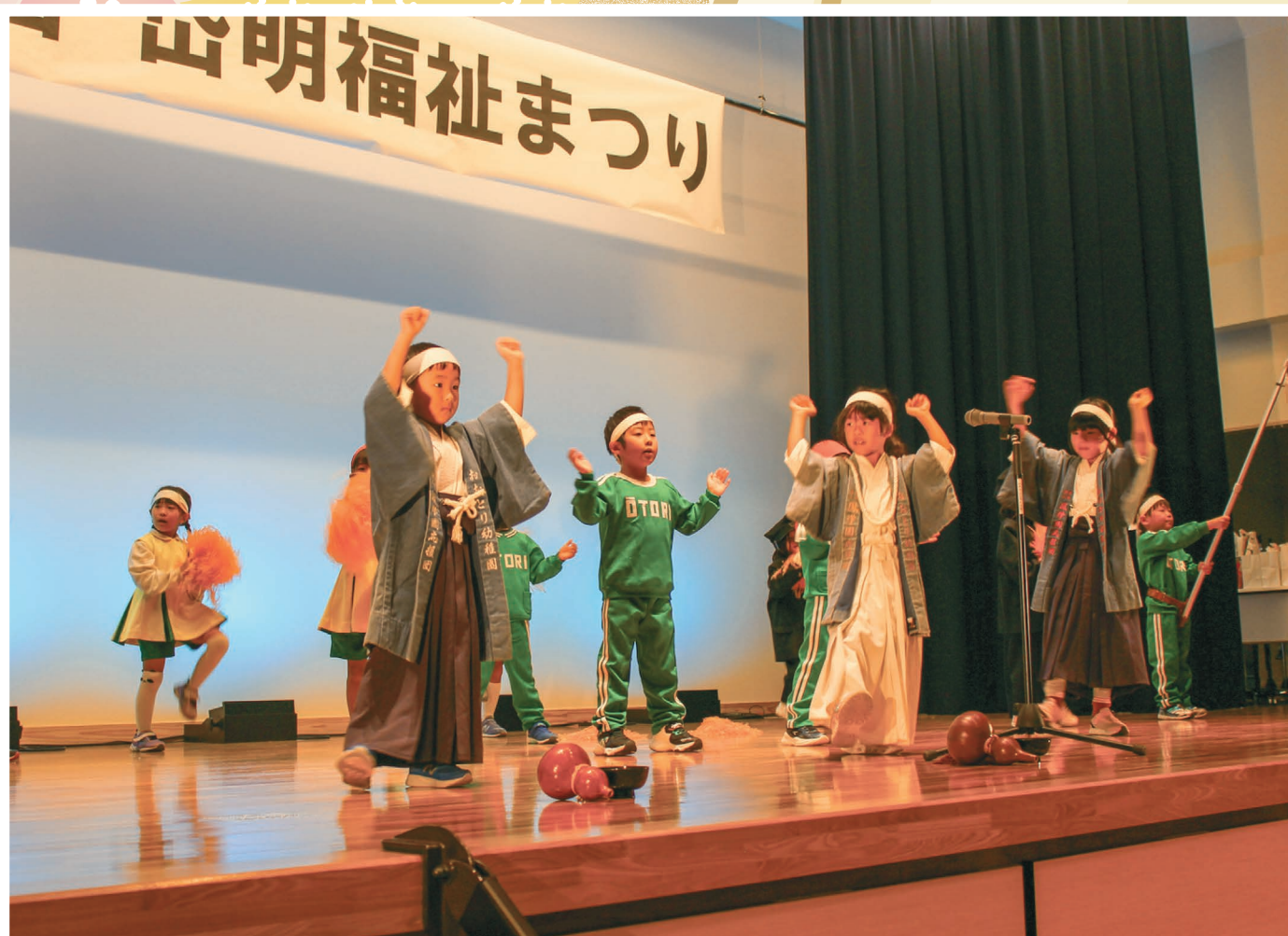
第34回岱明福祉まつり