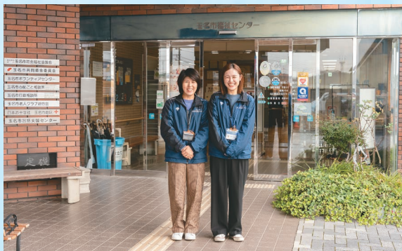
認知症地域支援推進員