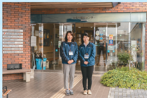
生活支援コーディネーター

住所：玉名市岩崎88-4 玉名市福祉センター内 TEL：71-0285 FAX：71-0360