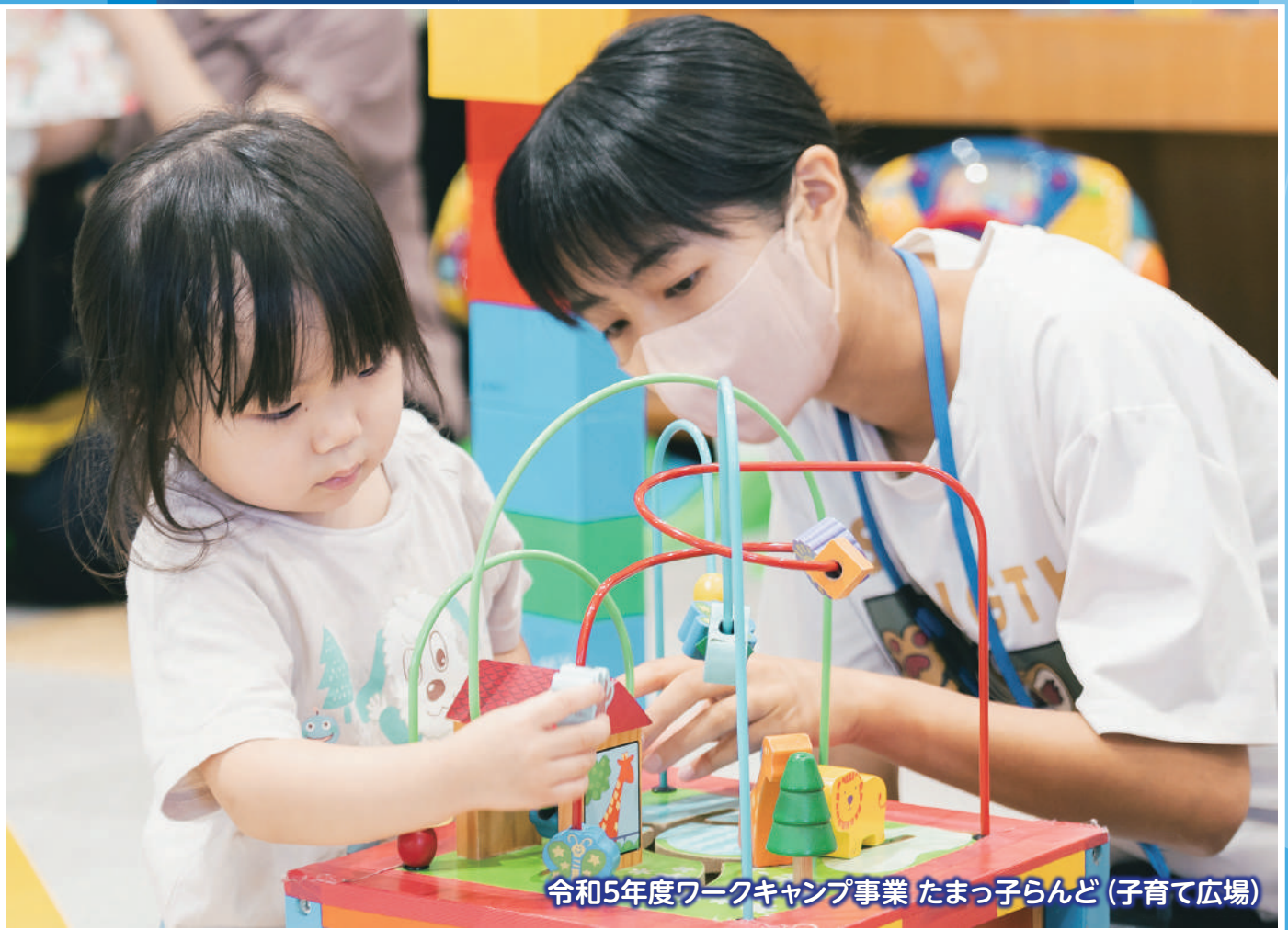
令和5年度ワークキャンプ事業 たまっ子らんど（子育て広場）