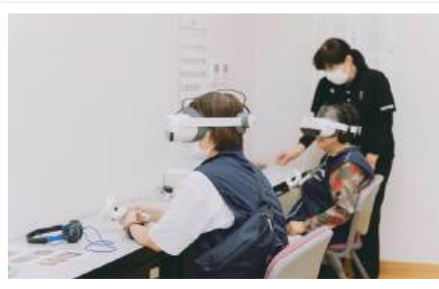
VR 避難シミュレーション