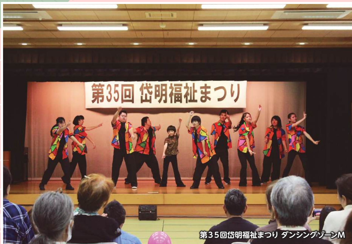
第35回岱明福祉まつり ダンシングゾーンM