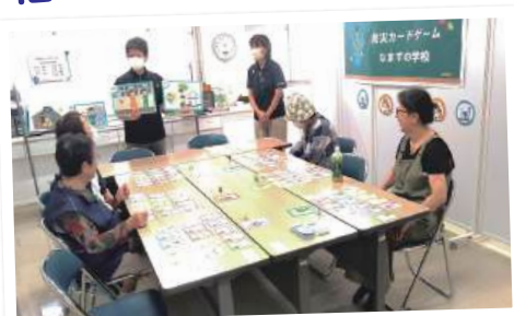
防災ゲームなまずの学校

他にも、防災ゲームやVR避難シミュレーションなど様々な体験をしていただきました。