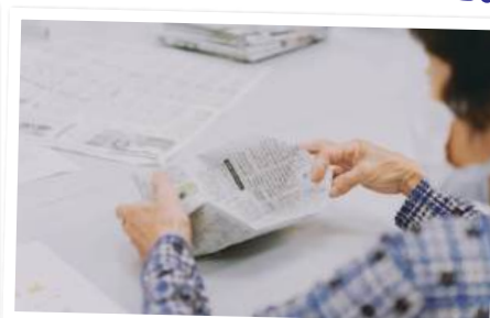
新聞紙皿づくり体験